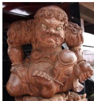
西船馬町 祭車 文久2年 力神