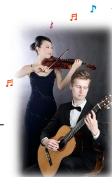
出演：DuoEquinox (デュオ・エクイノックス)